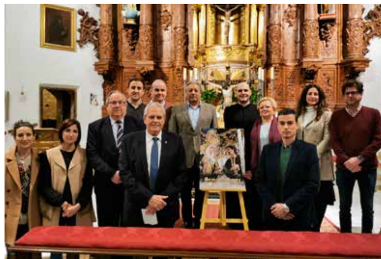
Presentación del cartel en la Iglesia parroquial.