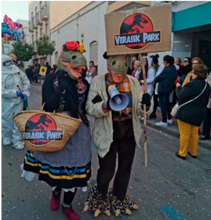
Ganadores concurso máscaras tradicionales "Verassic Park"

Destacó la recuperación del tradicional baile de carnaval en Terraza Carmona y la incorporación de cambios en el recorrido con la colocación de gradas para el público en la Calle del Mar.