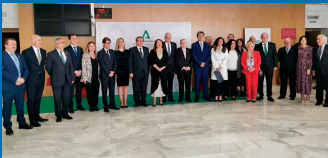
Autoridades y premiados en el hall del Teatro Auditorio “Ciudad de Vera”