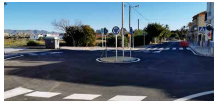
Obra ya terminada