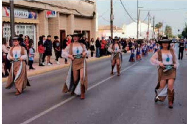
Muévete con nosotros