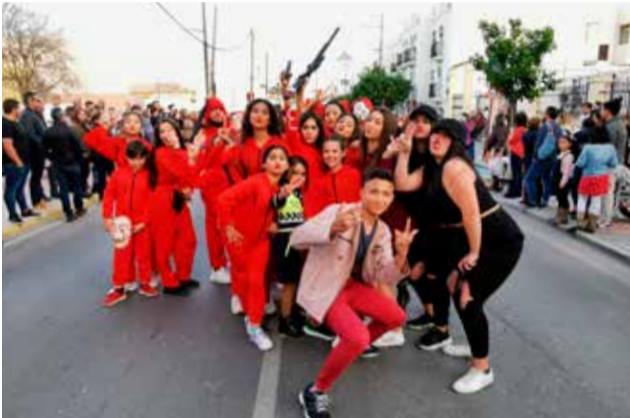
Casa de papel