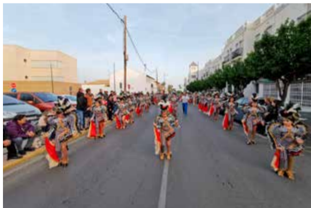
Cruz del sur