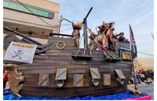
Barco pirata Lindrines