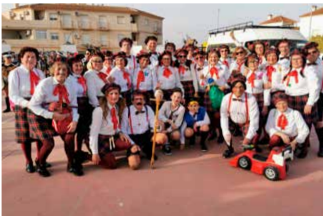
Club 3º edad San Cleofás