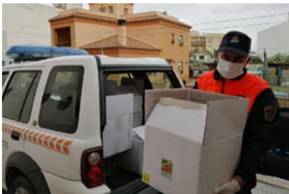
Voluntarios de protección civil desarrollando labores de atención ciudadana