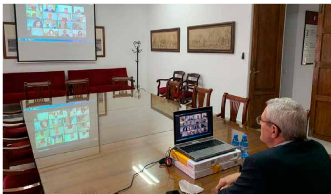
El alcalde de Vera, José Carmelo Jorge Blanco, siguiendo el pleno

también sirvió para dotar una partida de 200.000 euros, con el objetivo de establecer medidas económicas de apoyo a las pequeñas y medianas empresas de Vera, que se están viendo gravemente afectadas por la pandemia provocada por la crisis del coronavirus COVID-19.