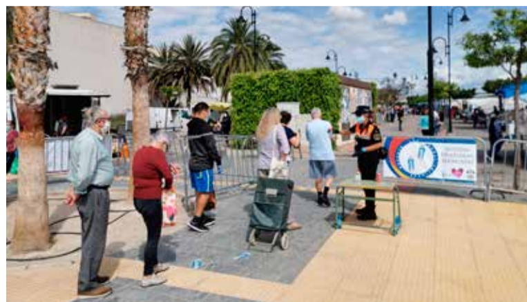
Acceso al mercadillo

Y por último en la fase III, podrán incrementar su actividad hasta alcanzar el 50% - 75% de los puestos o el aumento de la superficie, garantizando siempre una distancia de seguridad de 2 metros entre las personas.