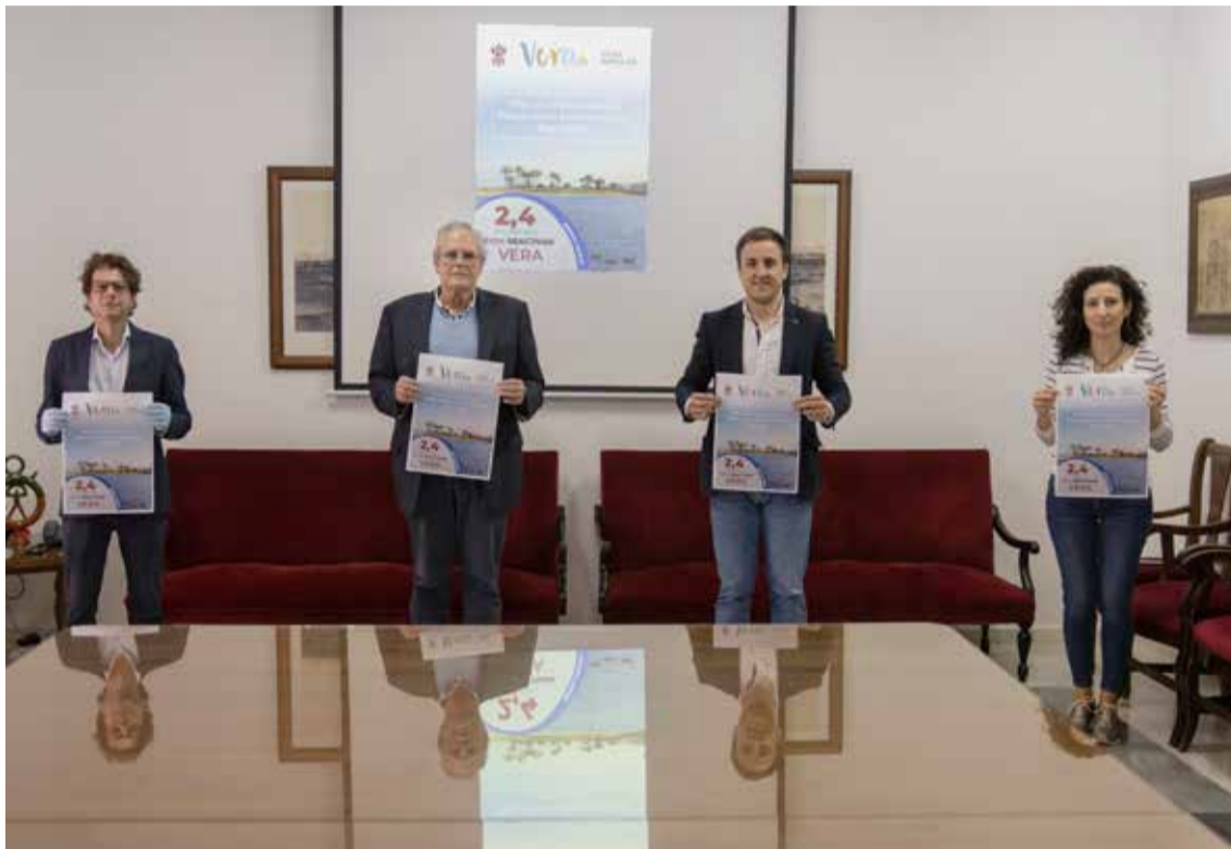
El alcalde de Vera, junto a concejales del Equipo de Gobierno durante la presentación del plan

de apoyo al sector turístico “volveremos a volar”; activación del servicio de asistencia a personas dependientes no acompañadas para realizar la compra de alimentos, productos farmacéuticos y de primera necesidad y entrega domiciliaria; suspensión del cobro de tasas por emisión de certificados de empadronamiento; etc.