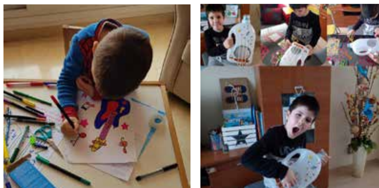
Alumnos de la Escuela de Música con sus trabajos durante el confinamiento