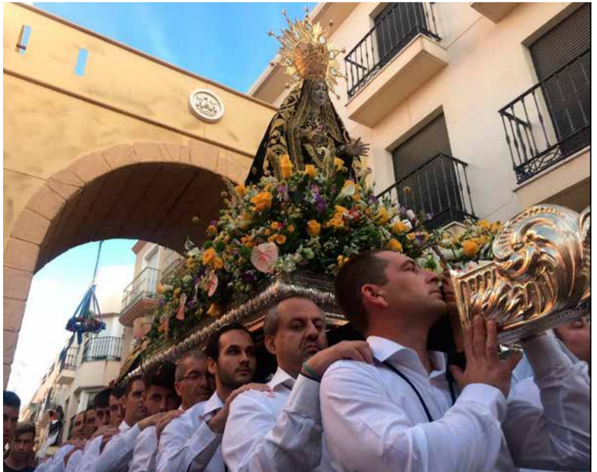
Imagen de la Procesión de la Virgen de las Angustias de 2019

Por su parte, el gran Desfile de Moros y Cristianos de Vera que se viene celebrando durante los últimos seis años (este año se hubiera celebrado la séptima edición) en el contexto de las fiestas patronales, se había convertido en una cita esperada por muchos vecinos y visitantes, ya que se trataba de la primera