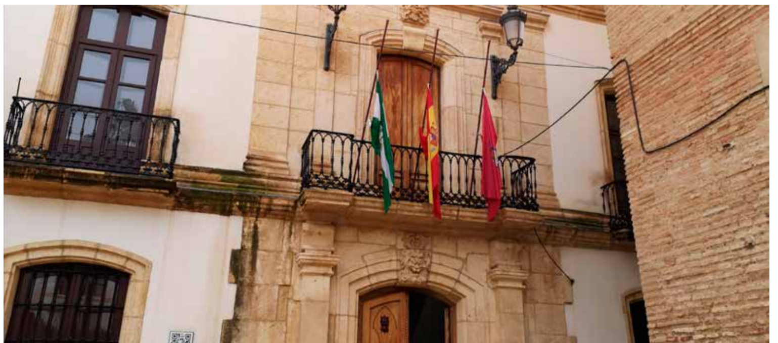
Imagen de la fachada de nuestro Ayuntamiento con las banderas ondeando a media asta