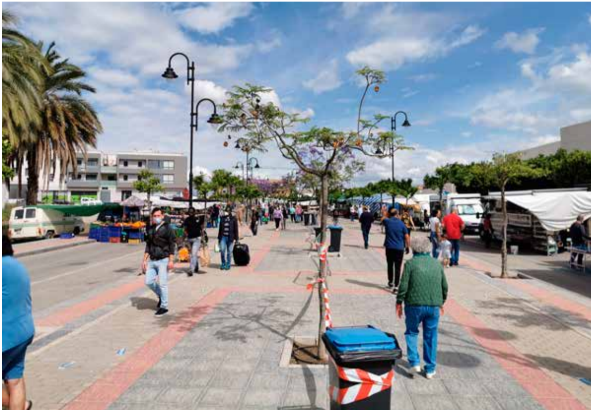
Vista general del paseo Miguel de Cervantes

Los puestos se distribuyeron de forma lineal en la calzada del paseo Miguel de Cervantes, en ambos sentidos, ocupando como máximo la anchura de la calzada hasta la