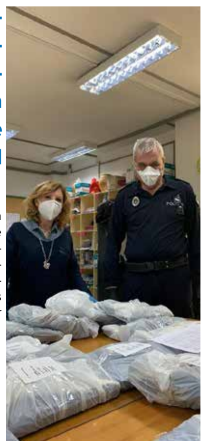
Distribución domiciliaria de ordenadores