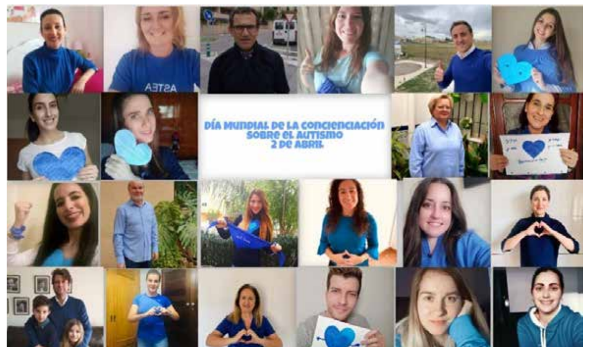
Día Mundial de Concienciación del Trastorno Autista