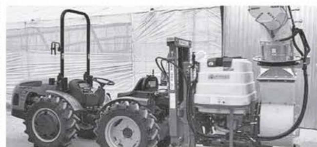
EL CONCEJAL se encargó de parte de la desinfección del pueblo durante un mes.

Aunque es una labor que "no es complicada", el edil reconoce que para realizar esta tarea es necesario "estar familiarizado con la máquina". Las tareas de desinfección y limpieza continúan a día de