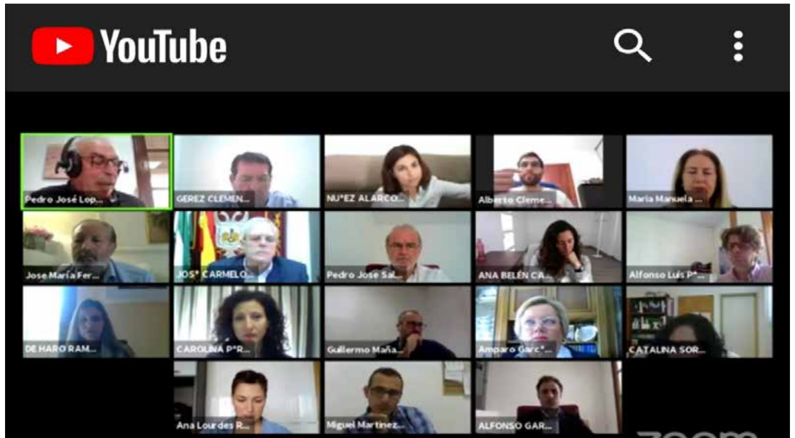
Corporación Municipal durante el transcurso del Pleno "virtual"