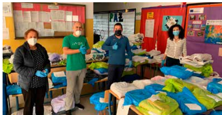
Distribución y reparto de material educativo