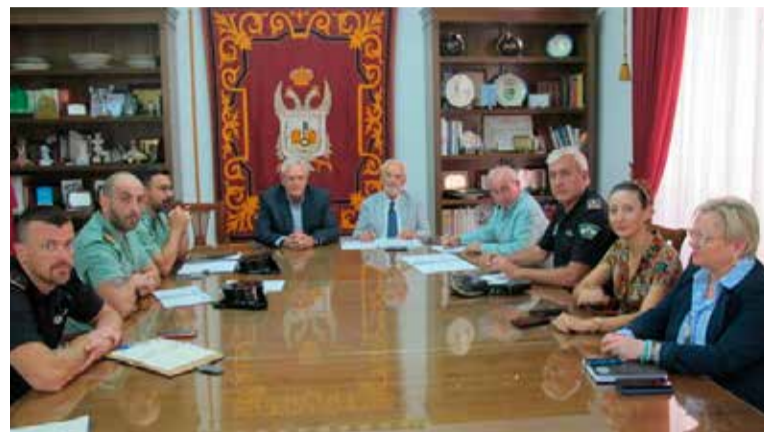
Imagen de archivo: Reunión de coordinación de Seguridad Fiestas San Cleofás 2019

Así como las actuaciones específicas para garantizar el cumplimiento de las medidas decretadas en el Estado de Alarma: número de personas identifica-