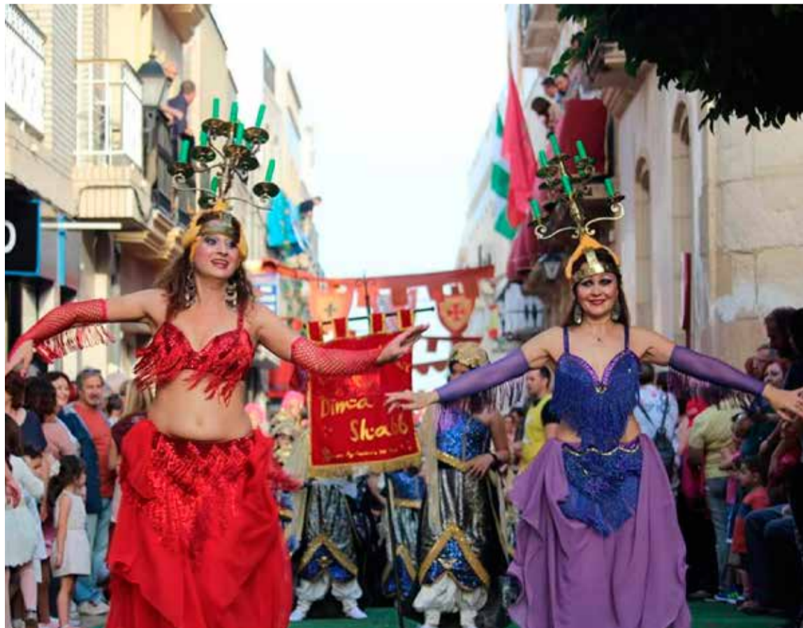
Imagen del Desfile de Moros y Cristianos

gran fiesta veraniega que marcaba el inicio de la temporada, congregando a miles de jóvenes y turistas en el municipio.