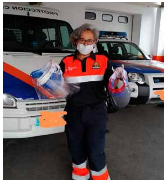
Los “CORONAMAKERS” de Vera han fabricado pantallas de protección para el personal sanitario, Policía Local y otros profesionales de actividades esenciales