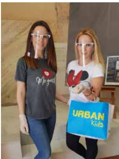
Comerciantes recogiendo pantallas protectoras

La concejalía de Comercio del Ayuntamiento de Vera, puso en marcha el Plan de Reparto de Material de Protección para Comercios y Empresas del municipio con la distribución de un kit compuesto por pantallas protectoras y guantes desechables.