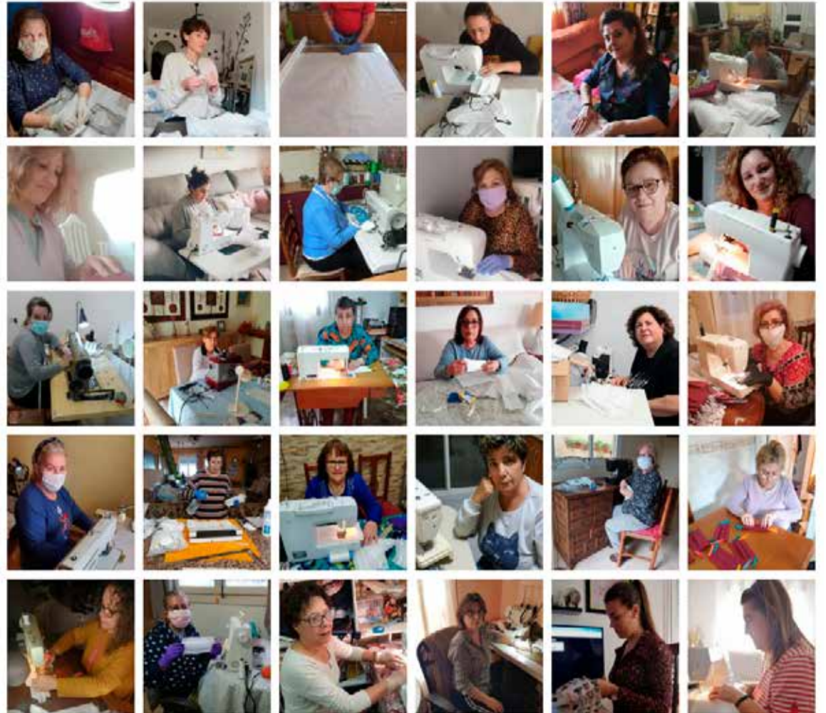
“Costureras de Vera”