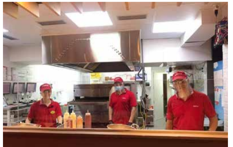
Empleados de hostelería utilizando las pantallas protectoras durante el desarrollo de su actividad

Según Ramírez, "esta actuación se incluye dentro del paquete de medidas destinadas a la dinamización del comercio local incluidas en el Plan de Reactivación Económica y Social para el Municipio VERA IMPULSA, con el objetivo de ayudar al comercio lo máximo, como motores que mueven un pueblo y una localidad".