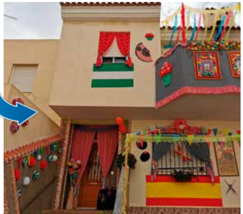
Fachada ganadora del segundo premio del concurso