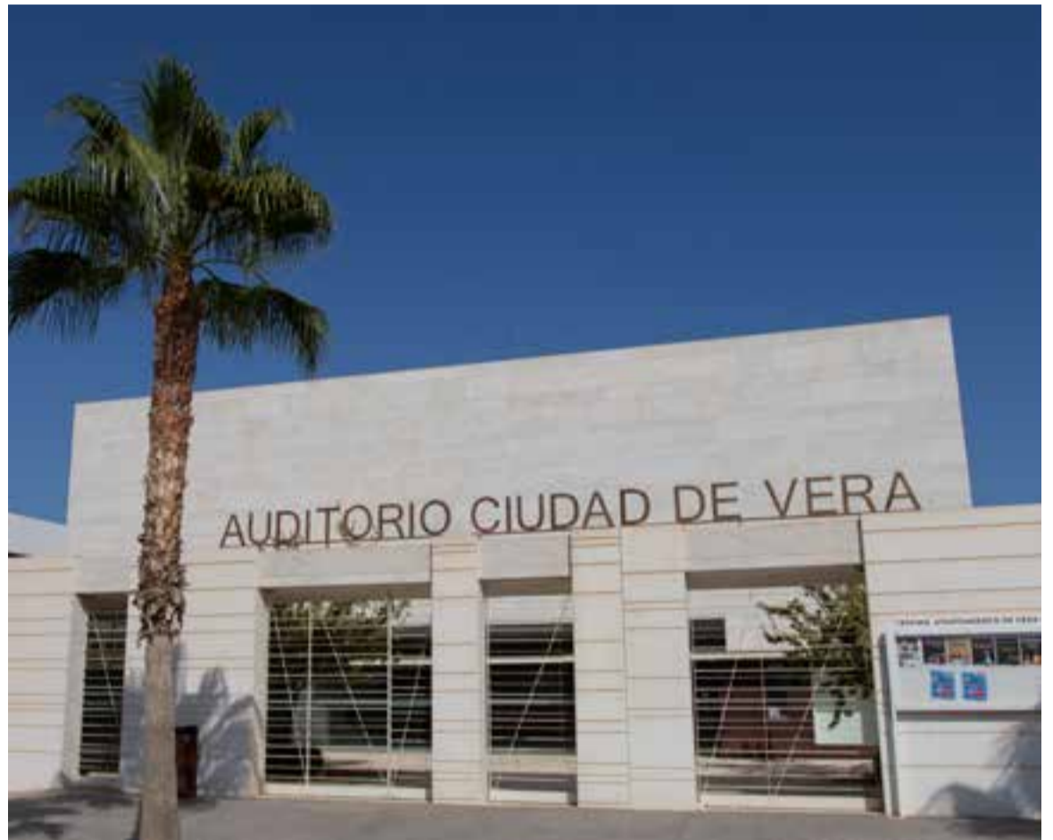
Teatro-Auditorio Ciudad de Vera

La concejal de Cultura, ha animado a “participar de las actividades con mucha responsabilidad”, recalando la importancia de “respetar las limitaciones de aforo, y seguir las recomendaciones de higiene, seguridad, distanciamiento social, y sobre todo aplicando mucho el sentido común”.