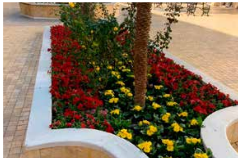
Jardines Plaza Mayor