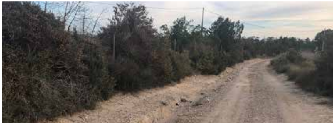
Estado actual del “Camino de Pescadores”

En este sentido, el edil veratense ha detallado que “los dos tramos que se beneficiarán de estas mejoras son el Camino Rural VE-031, más conocido como Camino de Pescadores con una longitud de 2.480 metros y el Camino Rural VE-011 conocido como Camino de Palomares con una longitud de la