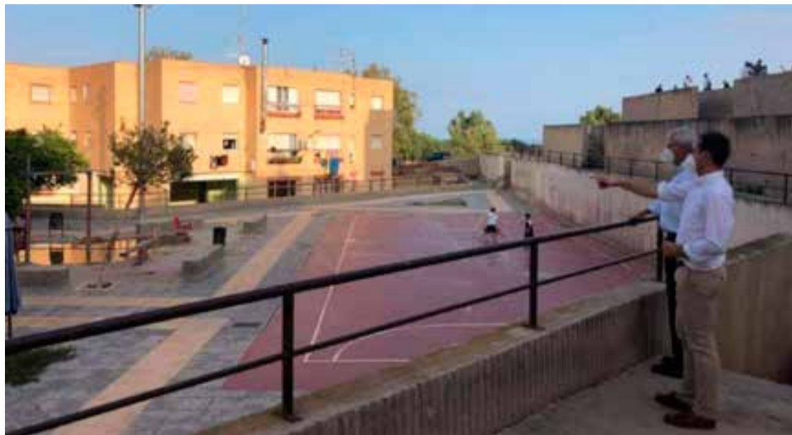
Alcalde y concejal de Infraestructuras supervisando inicio de obras

Según el alcalde, «nuestro objetivo es que las familias puedan disfrutar de su barrio y disponer de un parque, tener zonas habilitadas para aparcar, iluminación, infraestructuras básicas que no había anteriormente».