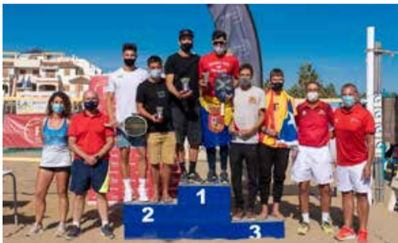
Podium masculino de la competición