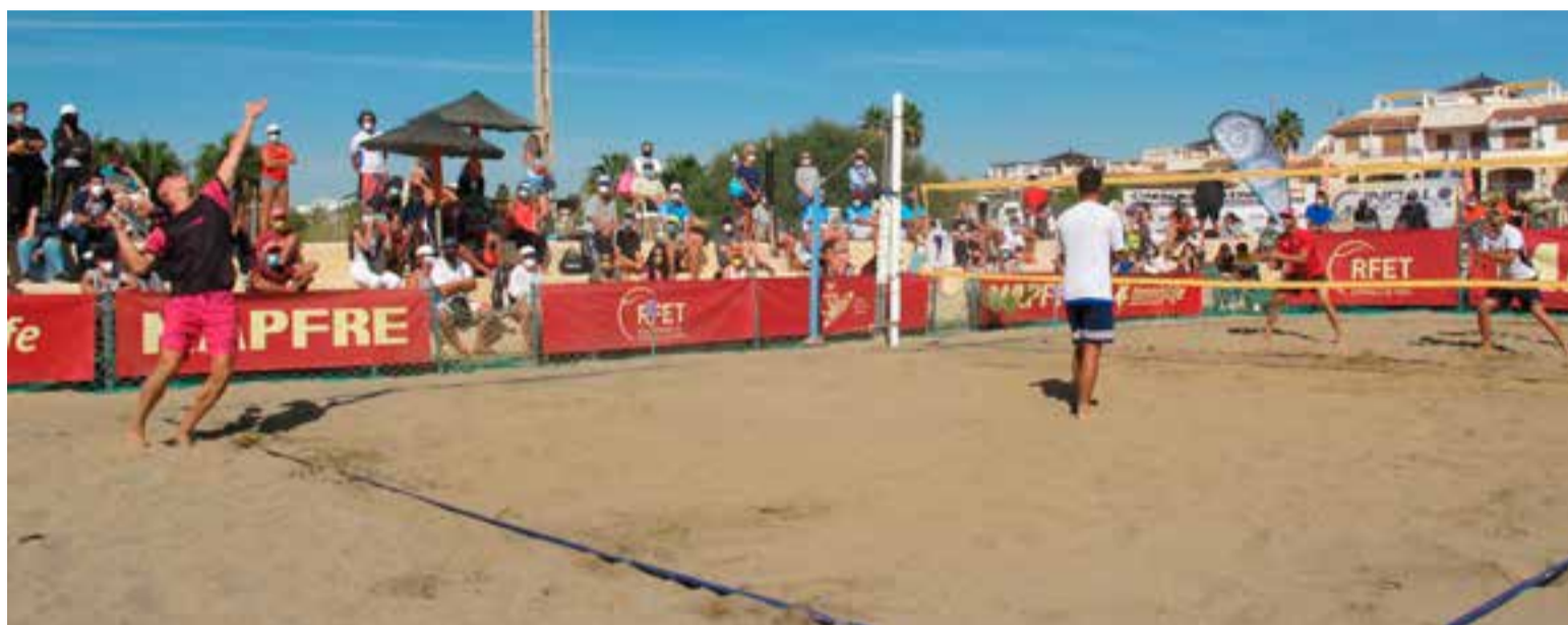
Momento de la final masculina

Una de las novedades de esta edición del Campeonato de España MAPFRE de Tenis Playa fue la