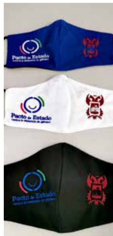
Diseños de las mascarillas

Teléfono nacional de atención a la violencia de género: 016