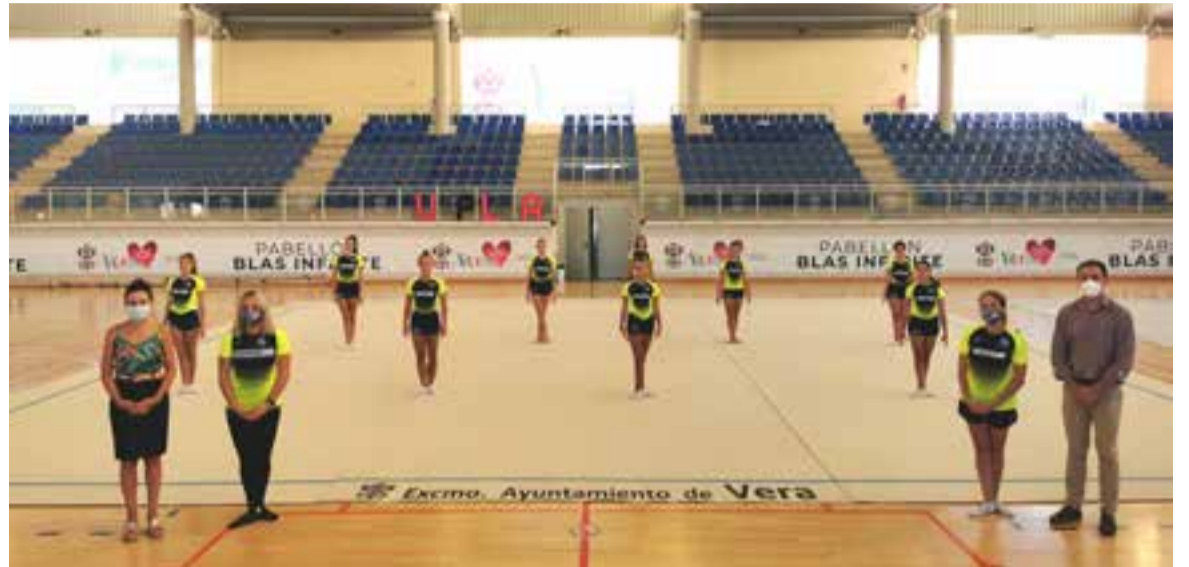
Inauguración del nuevo tapiz por las gimnastas del Club de Gimnasia Rítmica Vera

Los equipos federados del club de gimnasia rítmica vera-tense comenzaron por ello sus entrenamientos el pasado 15 de junio, siguiendo todos los protocolos establecidos por las autoridades sanitarias, y la idea es retomar cuanto antes la actividad de las escuelas deportivas municipales.