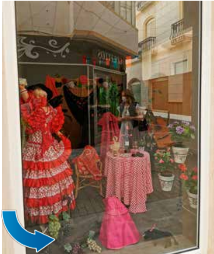
Escaparate ganador del primer premio

Isabel María Benítez Casas, resultó la ganadora de los 200€ del primer premio con una composición muy original en la fachada de un local en la Calle Mayor, donde no han faltado los mantones de manila, carteles de corridas de toros, capotes, banderillas, un maniquí con traje de gitana, las tradicionales cintas, y un bodegón con manzanilla, botijo y tocino, entre otros complementos alusivos a las tradicionales fiestas de Vera.