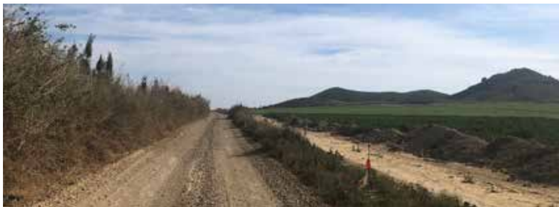
Estado actual del “Camino de Palomares”