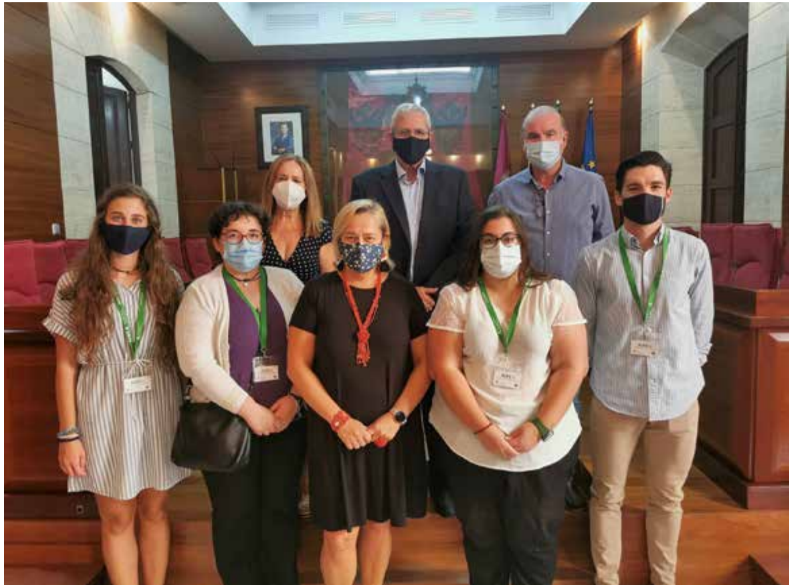
Bienvenida a los primeros trabajadores del Plan Aire

Los puestos de trabajo son muy variados, algunos con