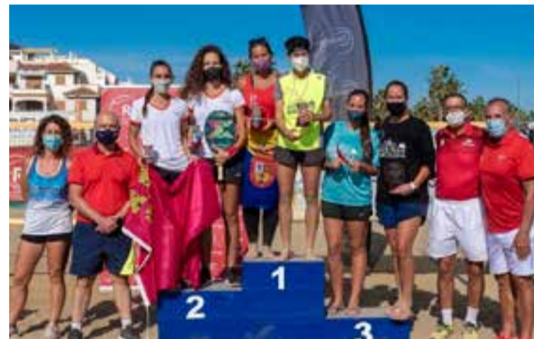
Podium femenino de la competición