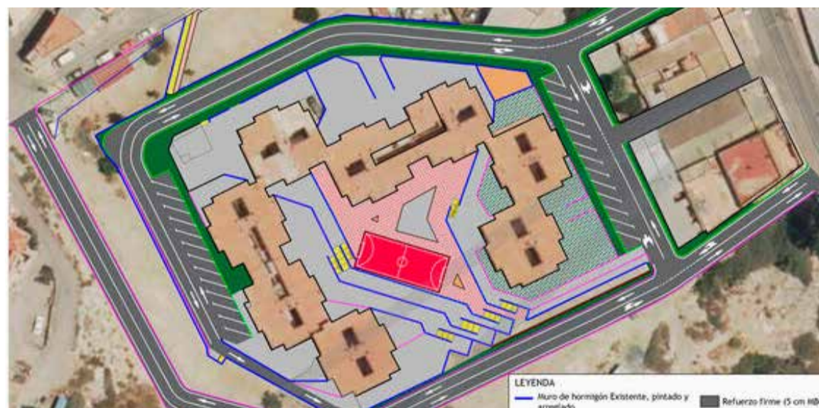
Proyecto de actuación