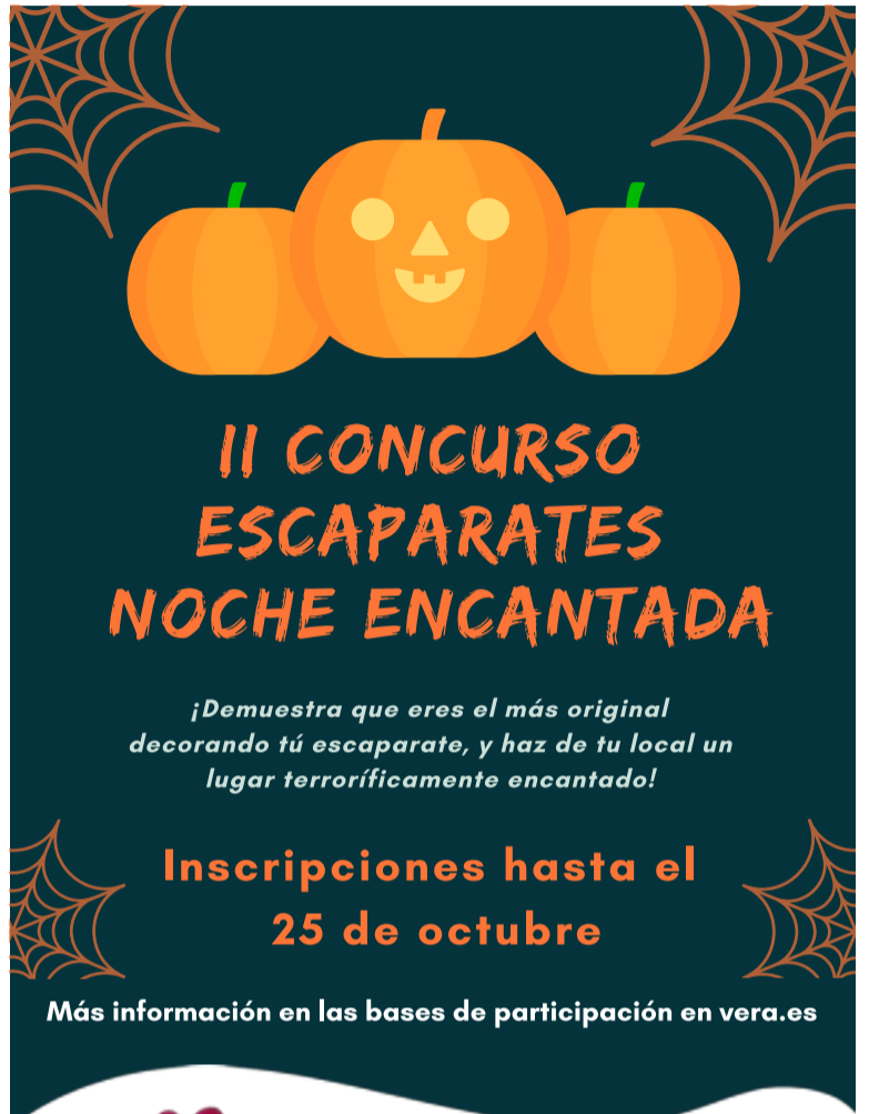
Cartel del concurso

Las inscripciones podrán realizarse hasta el 25 de octubre y