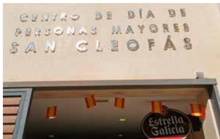
Centro de Mayores San Cleofás

Las jardineras de la Plaza Mayor y la fachada del Ayuntamiento también han sido decoradas con plantas del color de nuestra Bandera para conmemorar el Día de la Fiesta Nacional.