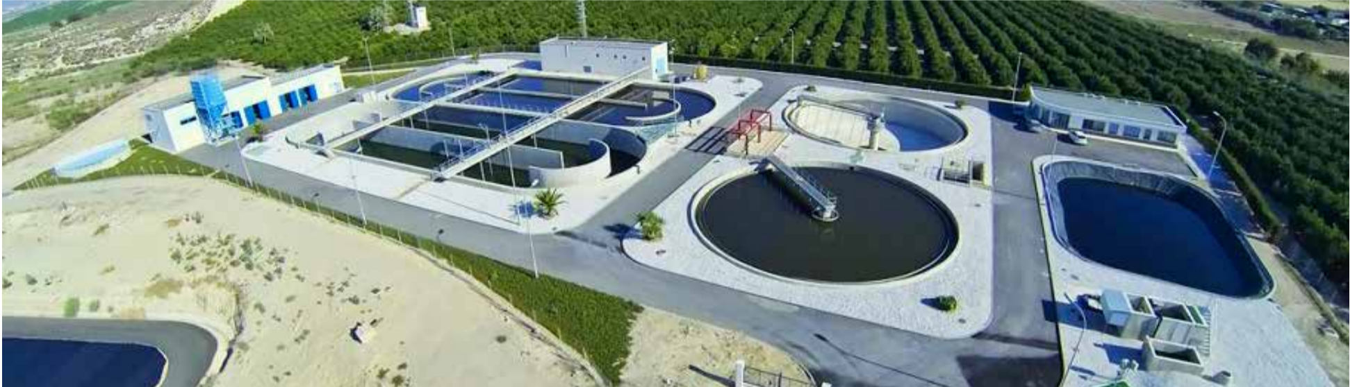
Imagen aérea de la Estación Depuradora de Aguas Residuales de Vera

• El Plan contempla la construcción de una nueva planta potabilizadora (ETAP), y una nueva planta desaladora del mar (EDAM).