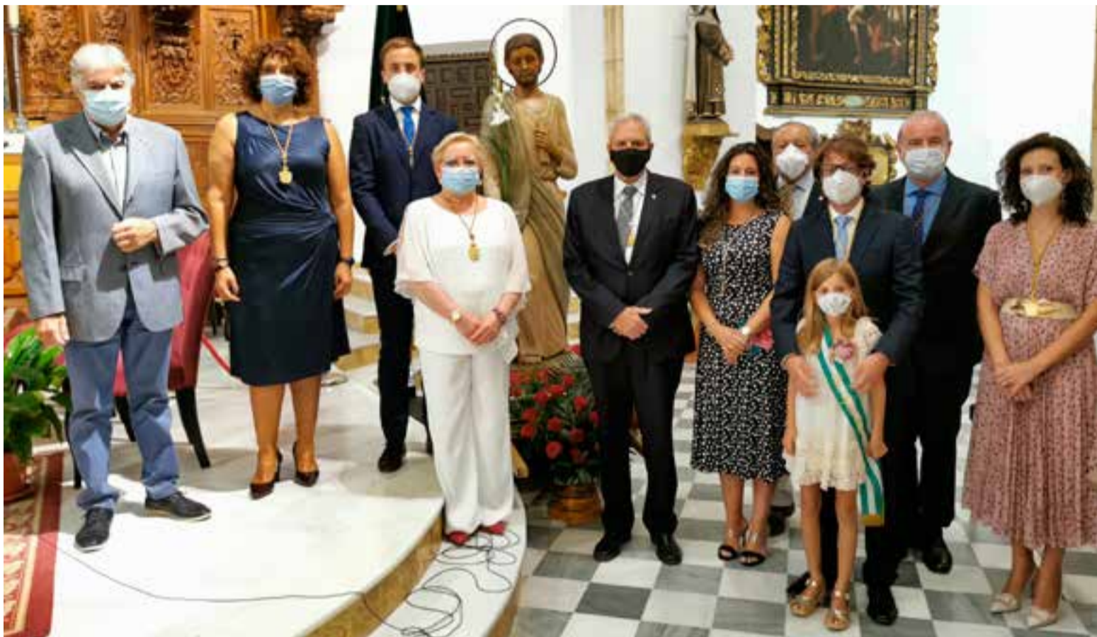
Miembros de la Corporación y el pregonero de la feria 2019 junto a la imagen de San Cleofás el día de la solemne eucaristía en su honor

Las fiestas de Vera, en honor a San Cleofás, se han visto alteradas por las restricciones ocasionadas con motivo de la pandemia sanitaria de la Covid-19, que se ha llevado por delante muchas de las actividades que normalmente se programaban para las mismas, pero no ha podido con la devoción de los veratense hacia su patrón, como se mostró en la Santa Misa en su honor, que se celebró el 25 de septiembre en la Iglesia Parroquial de Nuestra Señora de la Encarnación, con todas las medidas de seguridad que la normativa establece.