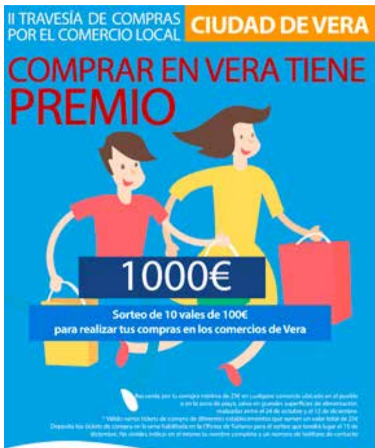
Cartel de la campaña

Un jurado, compuesto por personal cualificado, valorará la originalidad, montaje, estética, creatividad y el atractivo comercial de los participantes, que se repartirán 600€ en premios, con 300€ para el ganador, 200€ para el segundo premio y 100€ para el tercer premio.