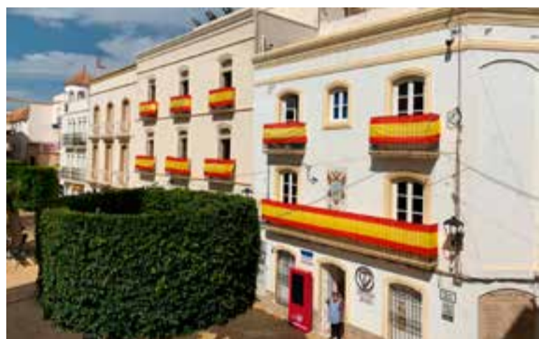
Fachada edificio municipal