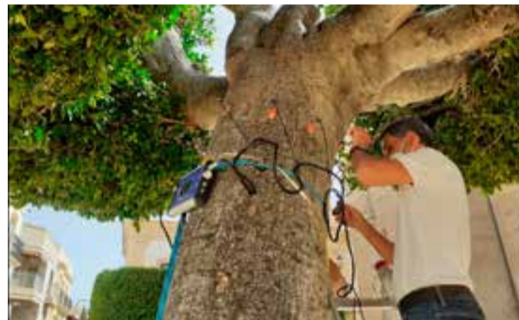
Instalación de electrodos en árboles