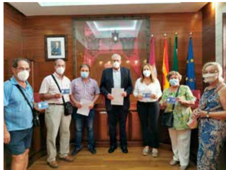
Presentación de la tarjeta VERAMAYOR en el Salón de Plenos

Sus beneficiarios son las personas mayores que cumplan los requisitos de contar con 65 años cumplidos a fecha de la solicitud de la ayuda y que estén en posesión de la tarjeta sesenta y cinco de la Junta de Andalucía, además de estar empadronados en el municipio. La presentación de solicitudes ya se puede tramitar de manera presencial en la Oficina de Atención al Ciudadano, Convento de la Victoria y en la Casa de la Juventud e Infancia “BAYRA”. También podrá realizarse de manera telemática en el Registro General Telemático del