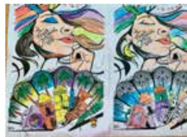
Dibujo de un escolar

Del reducido programa de actos que el Ayuntamiento ha organizado, ha destacado el concurso de engalanamiento de balcones y fachadas y la solemne Eucaristía en honor a San Cleofás, a la que sucedió el lanzamiento de cohetes y repique general de campanas coincidiendo con la hora en la que el Patrón de Vera debería salir en procesión por la ciudad.