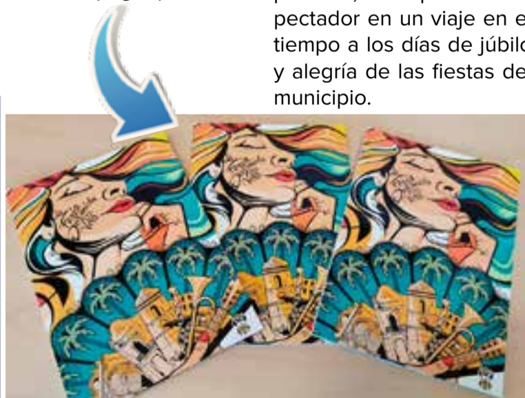
Libro de la feria

Otra de las actividades digitales puestas en marcha por la concejalía de Fiestas solidarias y la lucha contra el coronavirus. Además, el Ayuntamiento colgó en la web municipal el documental “La feria dormida, un viaje entre recuerdos”, un audiovisual histórico de las ferias del municipio, que a través de la recopilación de imágenes de ferias anteriores y una locución en primera persona, acompaña al espectador en un viaje en el tiempo a los días de júbilo y alegría de las fiestas del municipio.