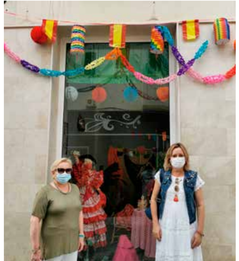
Concejal y miembro del jurado junto al escaparate ganador