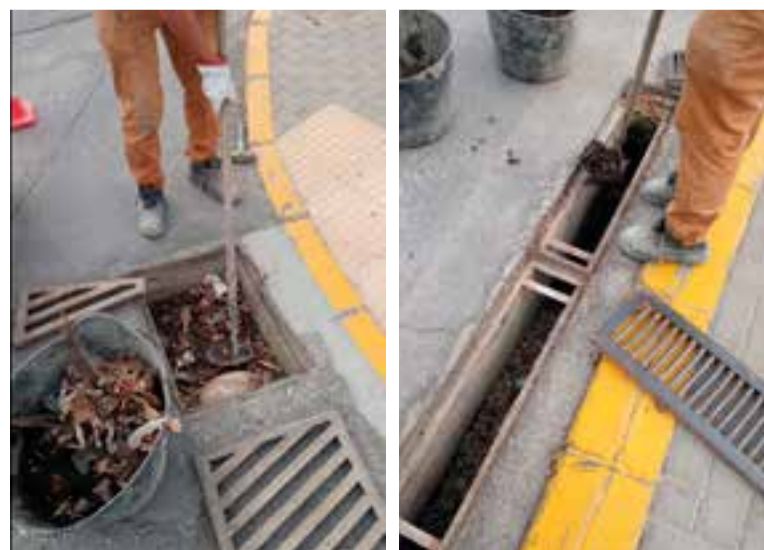
Operarios retirando maleza de imbornales