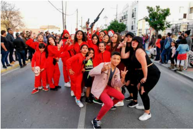
Casa de papel