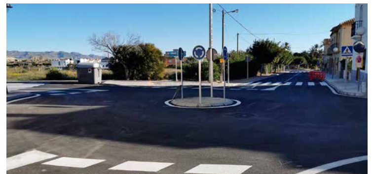
Obra ya terminada