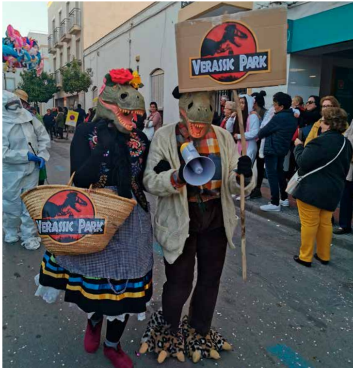
Ganadores concurso máscaras tradicionales "Verassic Park"

Destacó la recuperación del tradicional baile de carnaval en Terraza Carmona y la incorporación de cambios en el recorrido con la colocación de gradas para el público en la Calle del Mar.