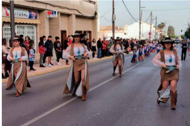
Muévete con nosotros