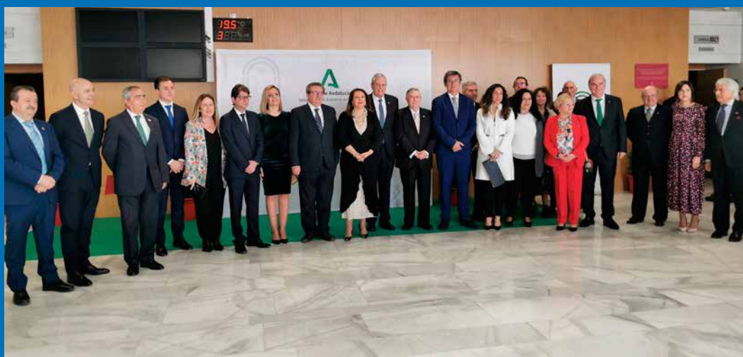
Autoridades y premiados en el hall del Teatro Auditorio “Ciudad de Vera”