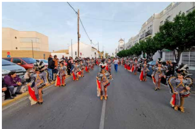
Cruz del sur