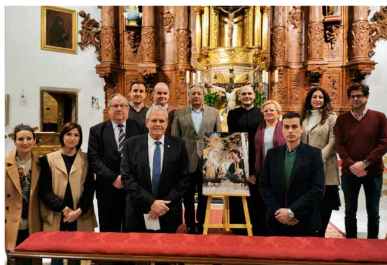
Presentación del cartel en la Iglesia parroquial.