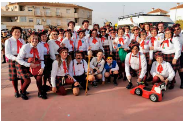
Club 3º edad San Cleofás