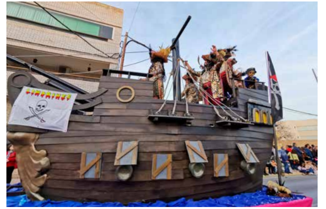
Barco pirata Lindrines